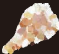
はちみつ シナモンシュガー