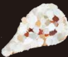
クリームチーズシュガー